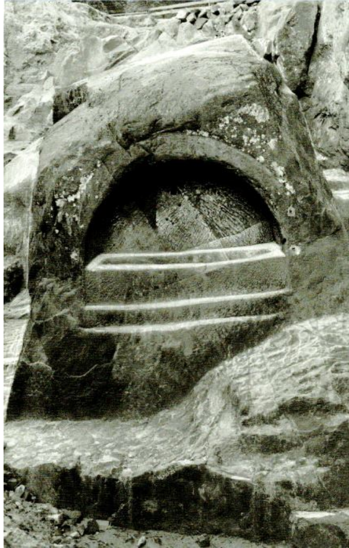
Grabfelsen vom Externstein nach Freilegung, 1932

Copyright ? Gerhard Hess / 13. Februar 2016