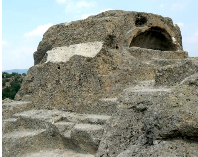
Urzeitliches thrakisches Kultgrab bei Tatul / Bulgarien