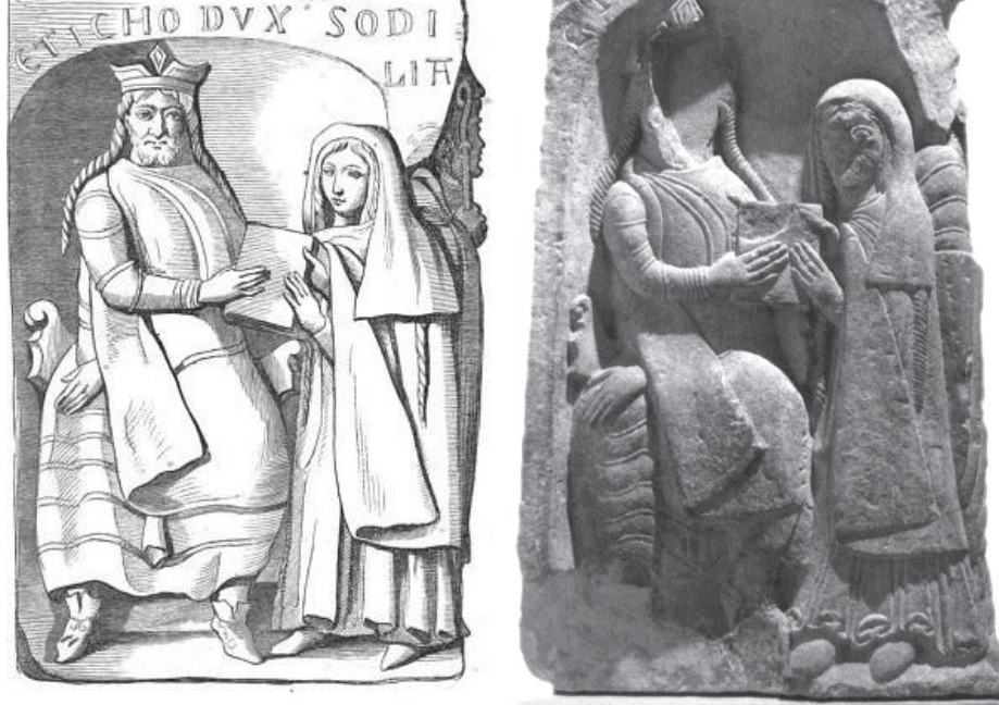
Abb. 2 - Steinrelief - Herzog Eticho mit Tochter Odilia, 12. Jh.