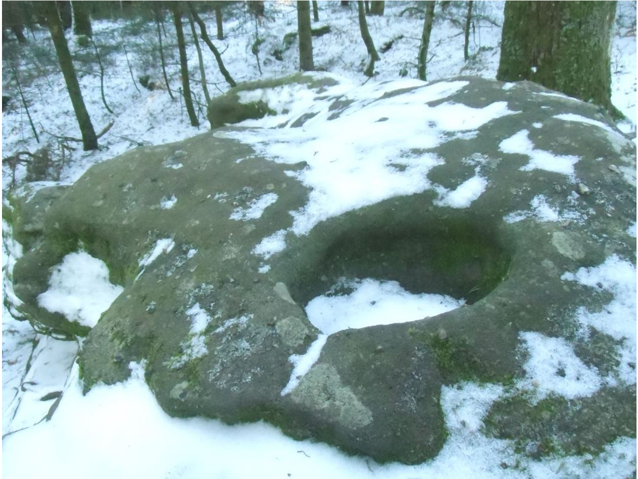
Abb. 1 - Foto von Karoline Groß - Opfer-Steinkessel auf dem Odilien-Berg

Copyright ? Gerhard Hess / 10.Januar 2017