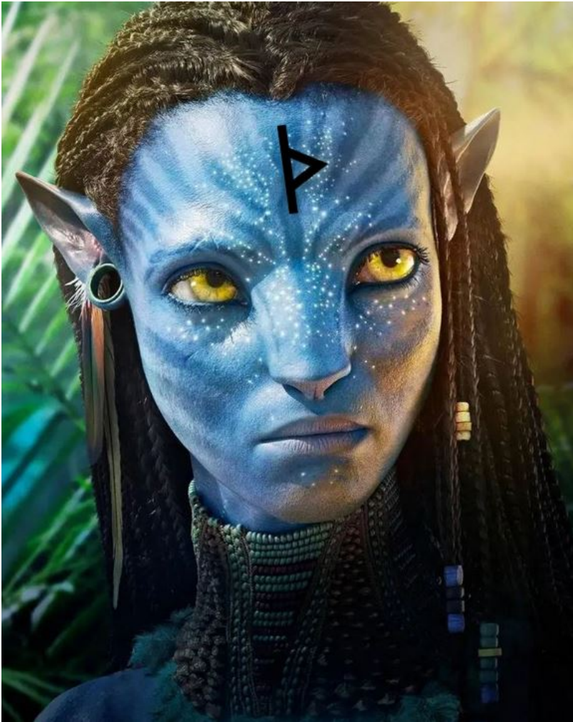
Versuch der Darstellung eines Dunkelalfen.