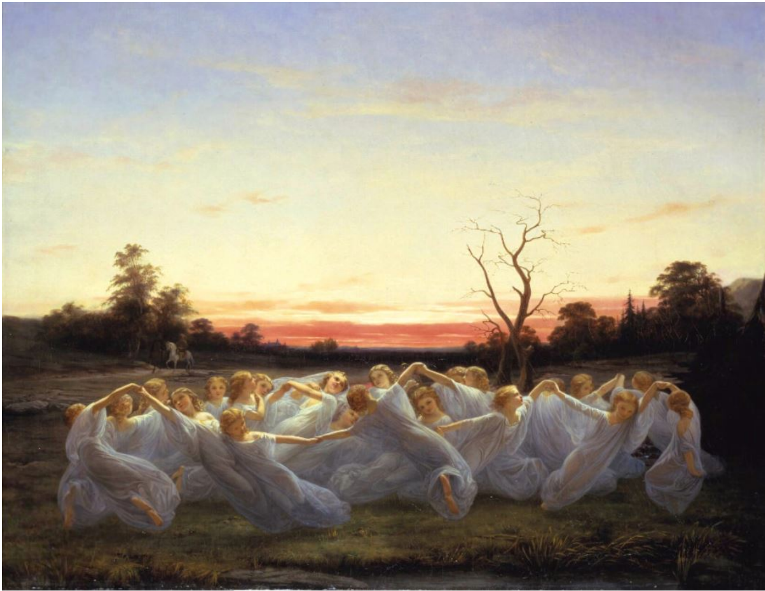
Wiesenelfen, Gemälde von dem Schweden Nils Blommér, 1850

Lichtalben (auch Lichtalfen oder Liusalben) sind in der nordischen Mythologie schöne, lichtgestaltige Wesen, die in Albenheim leben. Sie gelten laut der Snorra-Edda als schöner als die Sonne. Zuweilen wurden sie in der Edda als eine von drei Klassen (Licht-, Dunkel- und Schwarz-Alfen) unterschieden, wobei sie die Bewohner der reinen Lichtregion darstellen